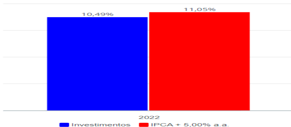
Investimentos x Meta de Rentabilidade

O retorno acumulado no período demonstrado no gráfico não supera sua meta de rentabilidade no longo prazo, devido aos atuais acontecimentos mercadológicos, podendo haver novos e maiores declínios, contudo, há grande possibilidade de retomada e conseqüentemente, novamente, voltar a superar a meta atuarial no longo prazo.