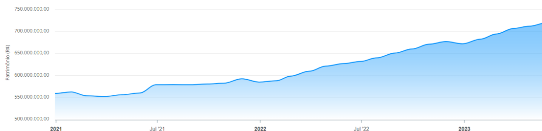
Evolução do Patrimônio

Destaca-se um crescimento contínuo e de boa curvatura evolutiva, não havendo períodos de retração ou declínio contínuo, havendo um leve aumento do patrimônio líquido ainda no primeiro trimestre de 2022, resultado esse devido ao desempenho do mercado financeiro.