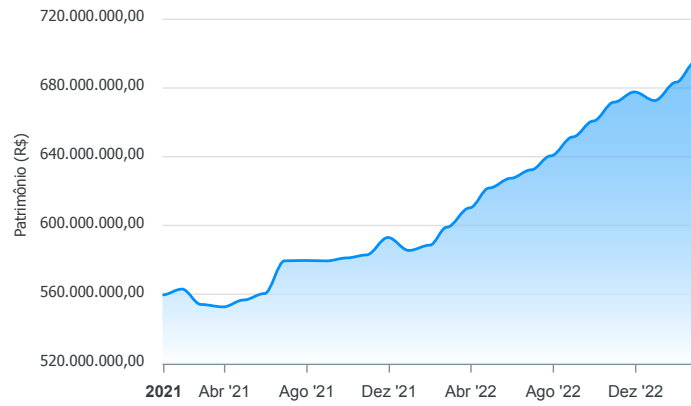
Evolução do Patrimônio